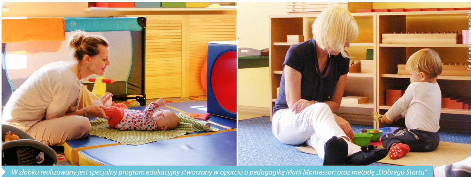
W żłobku realizowany jest specjalny program edukacyjny stworzony w oparciu o pedagogikę Marii Montessori oraz metodę „Dobrego Startu”

zmęczenie, może w każdej chwili położyć się i odpocząć – dodaje.