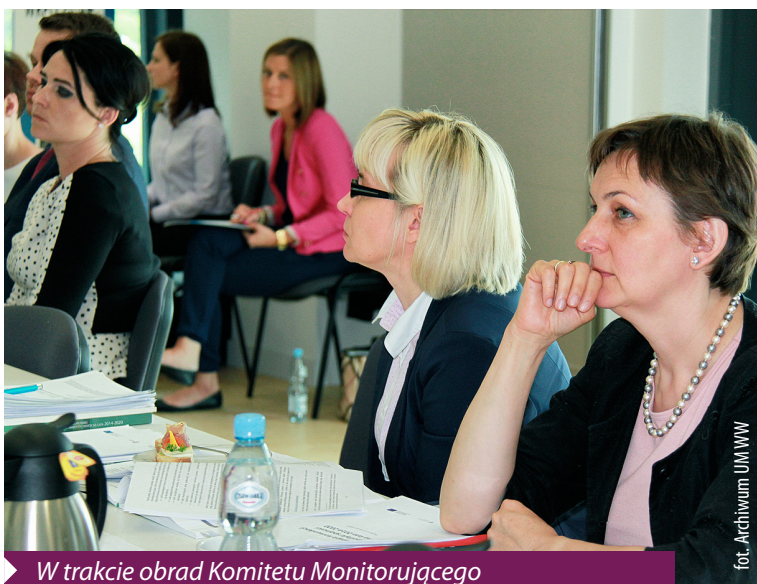
W trakcie obrad Komitetu Monitorującego