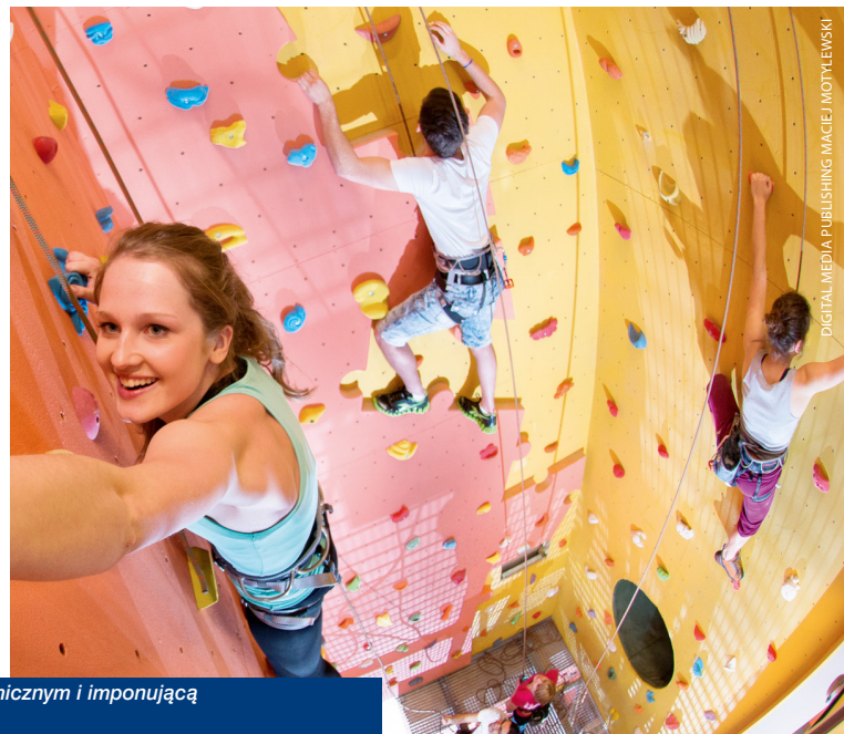
Wieża Ciśnień w Kościanie przyciąga turystów nowoczesnym obserwatorium astronomicznym i imponującą wewnętrzną ścianką wspinaczkową.

Jedną z najwyższych ścianek wspinaczkowych w Polsce, nowoczesne obserwatorium astronomiczne i zrewitalizowany park miejski to największe atrakcje traktu rekreacyjnego, który powstał w Kościanie dzięki wsparciu WRPO 2007-2013. Wzorowo przeprowadzona inwestycja zdobyła uznanie kapituły konkursu „Polska pięknieje”. Projekt znalazł się w finale plebiscytu nagradzającego najlepsze przedsięwzięcia, zrealizowane przy wsparciu unijnych funduszy i walczy o główną nagrodę w kategorii „obiekt turystyczny”.