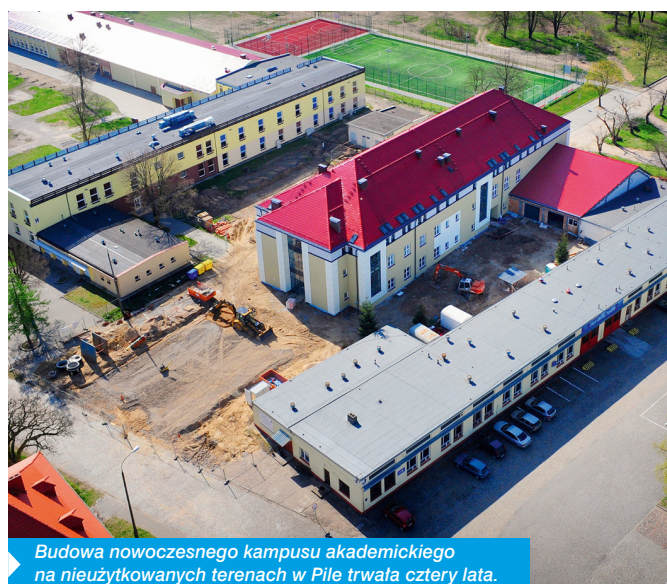
Budowa nowoczesnego kampusu akademickiego na nieużytkowanych terenach w Pile trwała cztery lata.

– W ramach środków działania 4.1 WRPO 2007-2013 Rewitalizacja obszarów miejskich oraz części pieniędzy z działania 1.4 Wsparcie przedsięwzięć powiązanych z Regionalną Strategią Innowacji realizowana jest Inicjatywa JESSICA. Do tej pory dzięki tej Inicjatywie podpisano 38 umów inwestycyjnych, obejmujących szeroki wachlarz projektów miejskich w zakresie rewitalizacji na łączną kwotę pożyczek w wysokości ponad 328 milionów złotych, czyli blisko 105% alokacji (wartość brutto projektów to ponad 600 milionów złotych). Realizowane przedsięwzięcia charakteryzują się dużym zróżnicowaniem – od budowy parku technologiczno-przemysłowego w Poznaniu czy adaptacji zabytkowej przepompowni na cele kulturalne w Ostrowie Wielkopolskim, do rewitalizacji targowiska miejskiego w Gnieźnie. Do tej pory udało się zakończyć realizację 23 projektów – mówi Hubert Zobel, dyrektor Departamentu Wdrażania Programu Regionalnego w Urzędzie Marszałkowskim Województwa Wielkopolskiego. – Z kolei w ramach działania 4.2 Rewitalizacja zdegradowanych obszarów poprzemysłowych