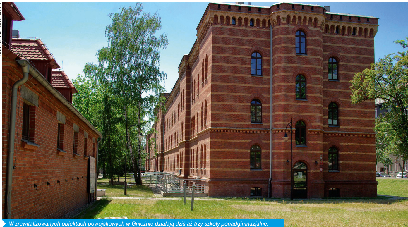
W zrewitalizowanych obiektach powojkowych w Gnieźnie działają dziś aż trzy szkoły ponadgimnazjalne.

słowych i powojkowych bezzwrotne dotacje otrzymało kilka inwestycji. Wsparto między innymi realizację inicjatywy Parafii Rzymsko-Katolickiej pw. Najświętszego Serca Jezusa, polegającej na rozbudowie, przebudowie i zmianie sposobu użytkowania obszaru przemysłowego w Śremie na Katolickie Centrum Edukacji i Kultury. Dofinansowany został także projekt zrealizowany przez spółkę Sport Pleszew, polegający na budowie kompleksu sportowego. Łączna wartość zrealizowanych projektów to ponad 129 milionów złotych, z czego unijne dofinansowanie wyniosło około 63,5 miliona złotych – dodaje.