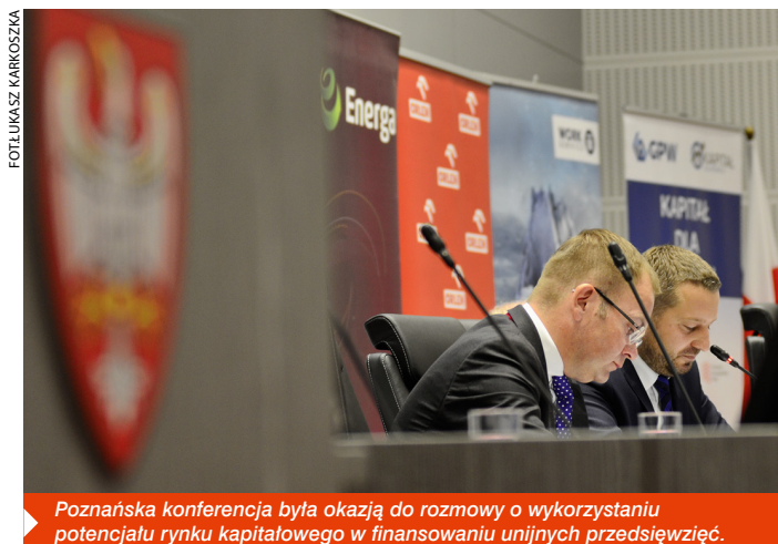
Poznańska konferencja była okazją do rozmowy o wykorzystaniu potencjału rynku kapitałowego w finansowaniu unijnych przedsięwzięć.

O tym, jak skutecznie pozyskać dotacje unijne oraz jak firmy i samorządy mogą wykorzystać możliwości rynku kapitałowego w poszukiwaniu pieniędzy na rozwój, rozmawiano 3 września w Sali Sesyjnej Urzędu Marszałkowskiego Województwa Wielkopolskiego podczas spotkania „Kapitał dla rozwoju”.